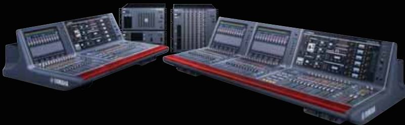
RIVAGE PM10 Digital Mixing System

Live Depends on Us Your mixes. Our consoles.